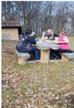
Trojdnňové seniorské stretnutie na chate Rázdel

sme v rámci tohto projektu začali pokračovali v organizovaní 3-dňových stretnutí pre klientov a rodinných príslušníkov, čo si veľmi cenia ako klienti, tak aj rodiny. A v neposlednej rade aj my ako personál, keďže vidíme pozitíva, ktoré tieto víkendovky prinášajú. Organizujeme ich buď v priestoroch RC Žibritov a Krupina alebo na chate neďaleko RC (ktorá nám poslúžila aj v minulom roku), ktorá je umiestnená priamo v lese. Čiže okrem odbornosti našim pracovníkov si príbuzní môžu oddýchnuť a čerpať z prírody, ktorá im to ponúka. Prežívajú častokrát hektické chvíle, ktoré so sebou život prináša a sme radi, že môžeme skĺbiť príjemné (oddych) s užitočným (stretnutie s príbuzným pod dohľadom odborného tímu).