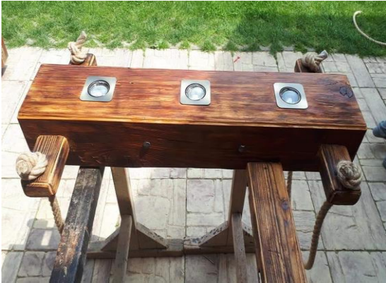
Výroba osvetlenia do jedálne

Nakoľko sme v minulosti zriadili stolársku dielňu, kde klienti vyrábali drevené hračky, začali sme v tejto dielni za pomoci šikovných klientov, ktorých práca s drevom teší a vidia v nej zmysel, vyrábať rôzne dekoratívne predmety, ktorými si skrášľujeme vlastné priestory.