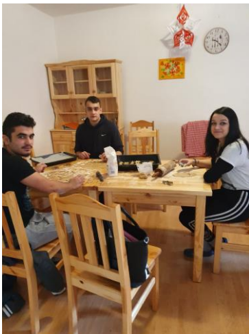
Príprava maškrt v Krupine a na Žibritove