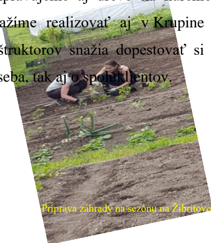
Príprava záhrady na sezónu na Žibritove