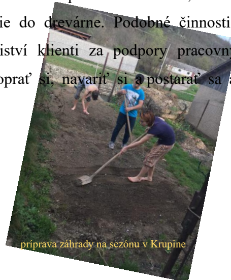
príprava záhrady na sezónu v Krupine