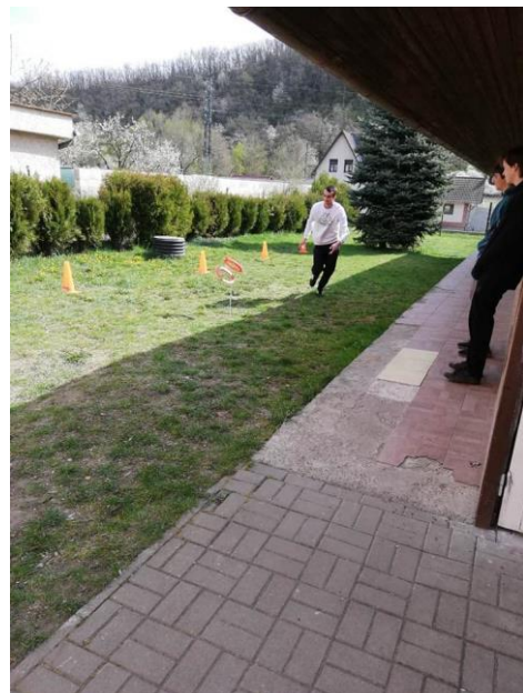
Šport v Krupine

Každý rok sa zúčastňujeme programu ku dňu MDD, kde si naši klienti pripravujú svoju časť (tento rok to boli Šmolkovia)