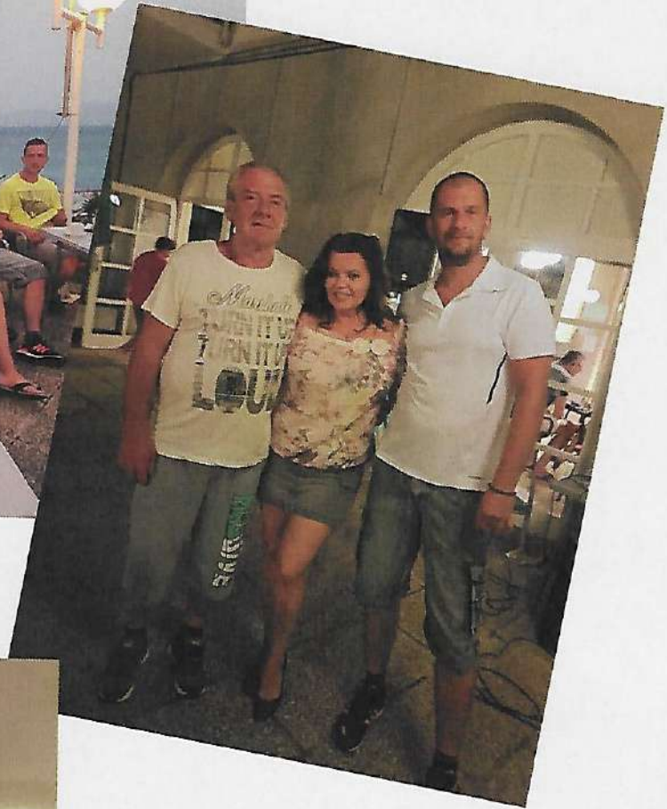
Prázdniny súrodencov v stredisku