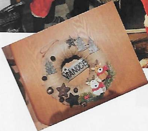
Mikuláš našich klientov pre našich klientov